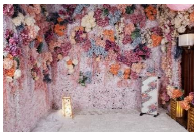
(左上) 和の町をイメージしたブース (中上) 遊郭を模したブース (右上) 将軍の間のブース (左下) 桜の間と富士の間 (右下) 写真映え間違いなしのフラワーウォールも用意